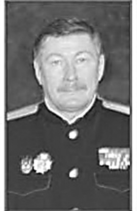
Атаман Центрального казачьего войска России В.И.Налимов