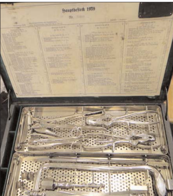
Инструменты судового врача немецкой подводной лодки. 1939 год