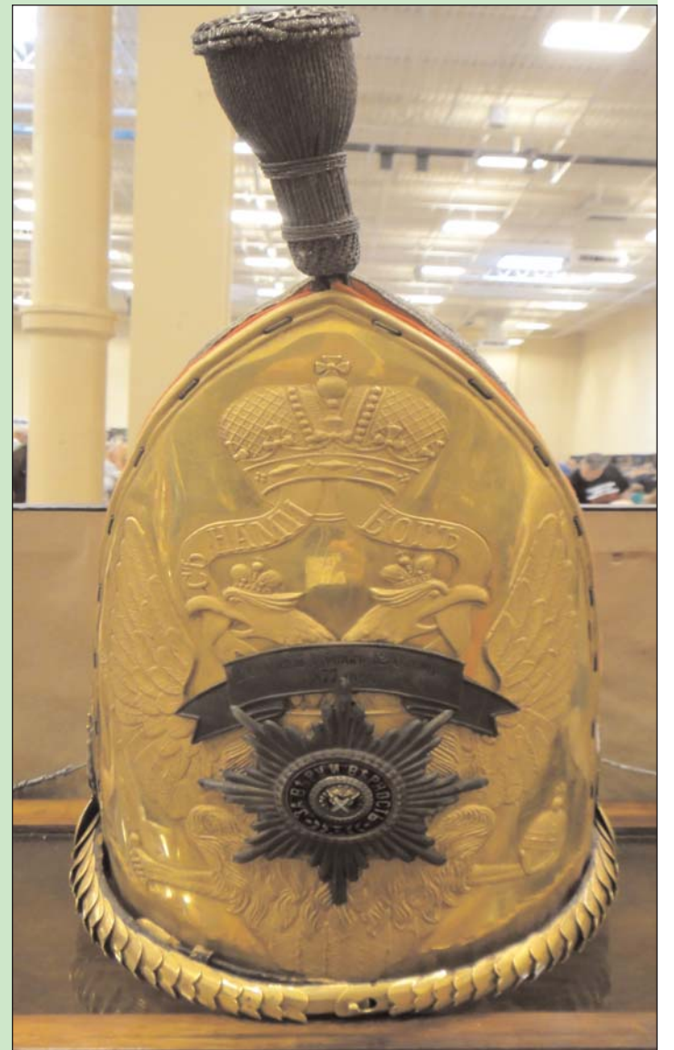
Митра офицера Павловского Гренадерского полка. Российская Империя