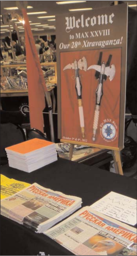
“Русская Америка” - единственная русскоязычная газета США, которая была аккредитована на всех выставках MAX SHOW

The Best All-Militaria Show In the World! All periods represented: Edged Weapons, Uniforms, Headgear, Samurai Swords, Medals, Documents, Books, Civil War, WWI, WWII, Vietnam, ATF Curio & Relic-Approved Military Guns ONLY. This Year the MAX show will be held at the Monroeville Convention Center, just outside of Pittsburgh, PA. Show dates are October 4 - 7, 2012.