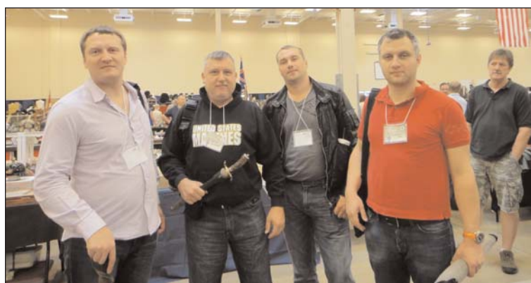
Гости из России - музейные работники и эксперты на MAX SHOW