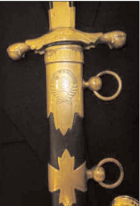
Редчайший кортик дипломата СССР, утвержденный в 1943 году