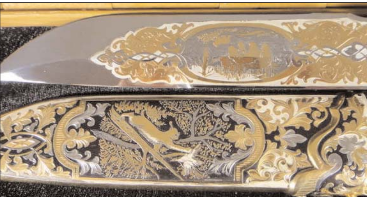
Охотничий нож златоустских мастеров. Россия