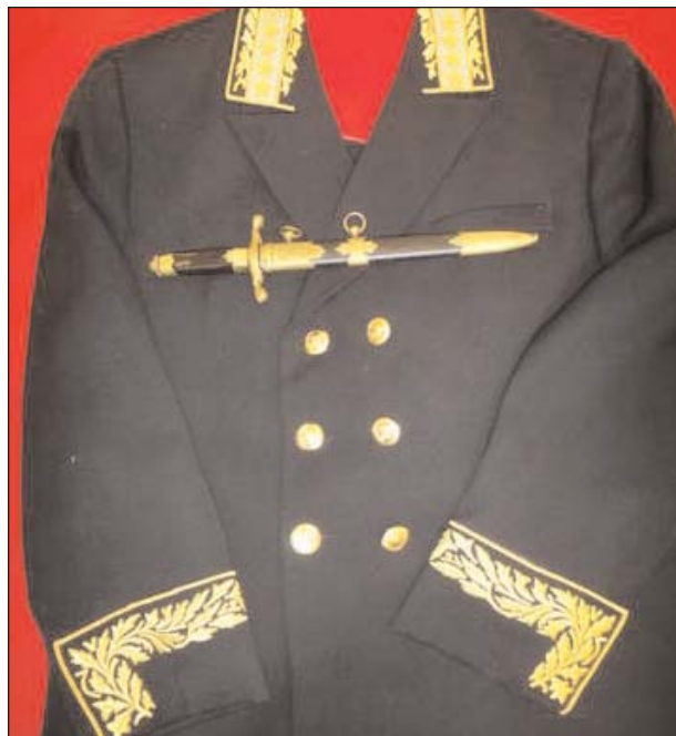
Мундир дипломата СССР высшего ранга с кортиком