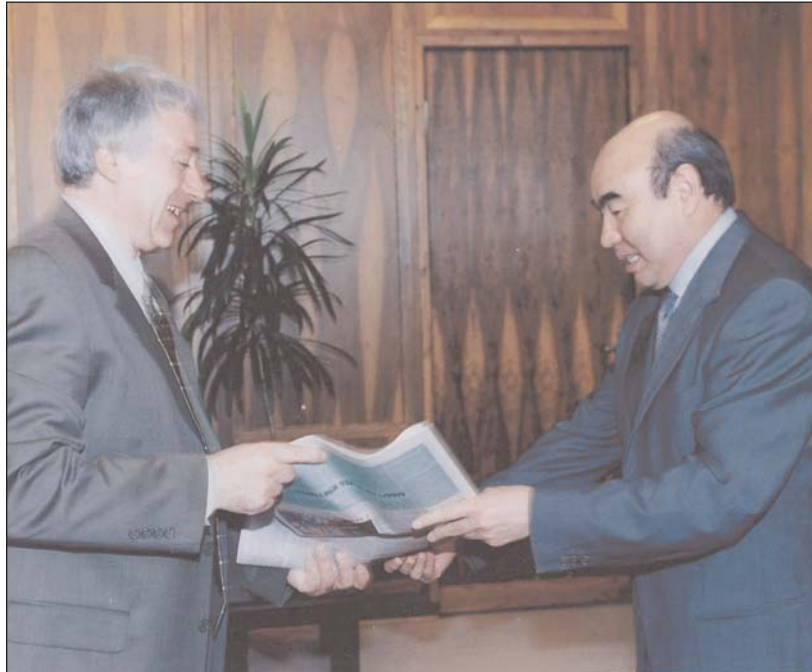
С Президентом Кыргызстана Аскармом Акаевичем Акаевым