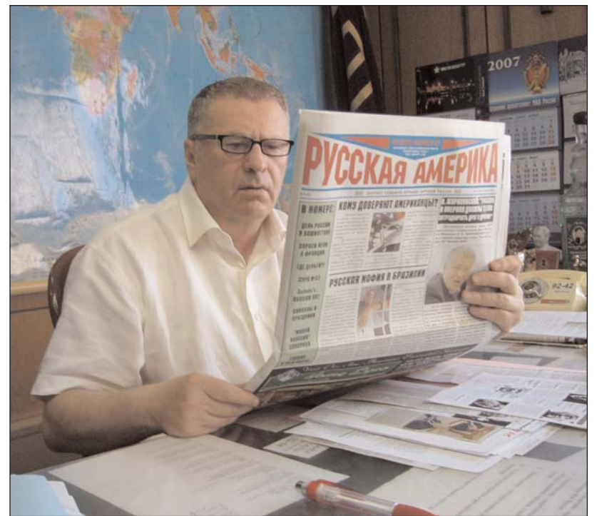
Вице-спикер Госдумы, лидер ЛДПР Владимир Жириновский