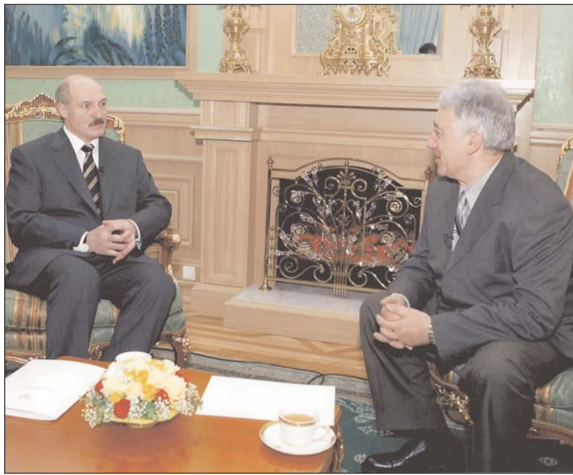
С Президентом Белоруссии Александром Григорьевичем Лукашенко