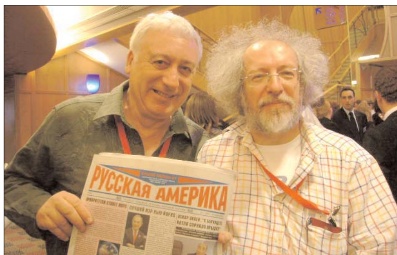
С Главным редактором Радиостанции "Эхо Москвы" Алексеем Венедиктовым