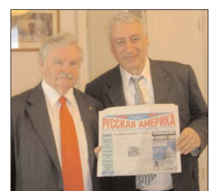
С Председателем Российского детского фонда Альбертом Лихановым