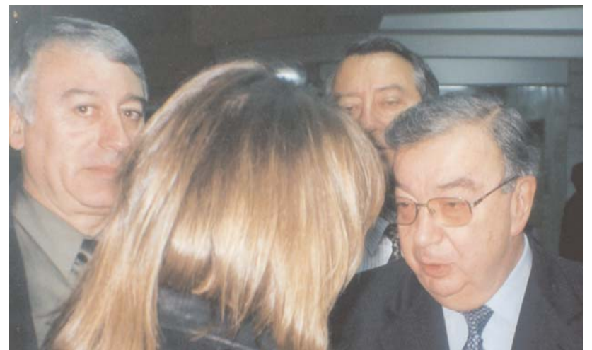
С Евгением Максимовичем Примаковым, председателем правительства Российской Федерации