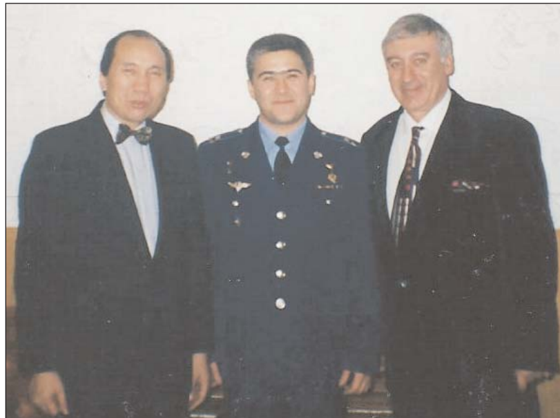
С Госсекретарем Кыргызстана Османакуну Ибрагимовым и космонавтом Салиханом Шариповым