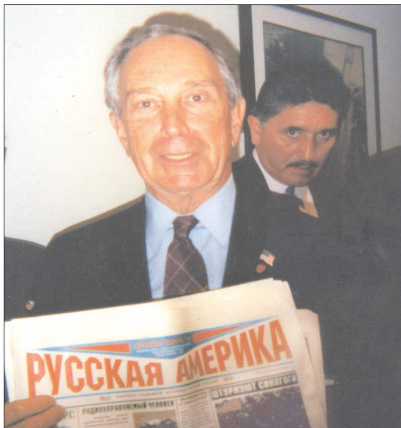
Мэр Нью-Йорка Майкл Блумберг