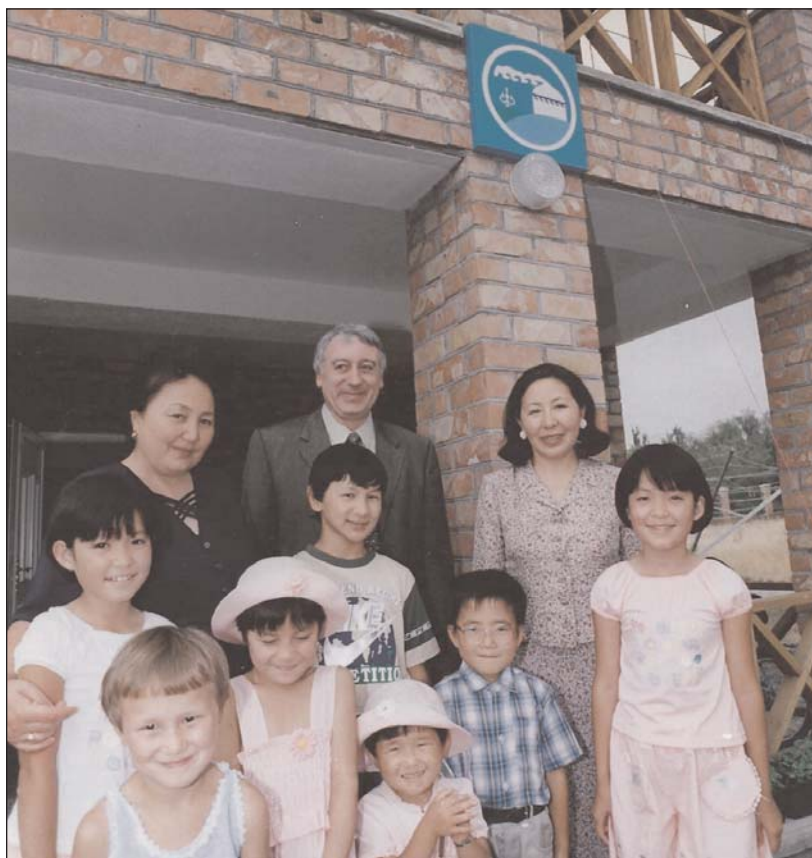
С Первой леди Кыргызстана Майрам Акаевой в Детской деревне