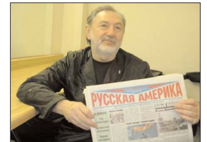
Художественный руководитель ансамбля «Сябры», Народный артист Республики Беларусь Анатолий Ярмоленко