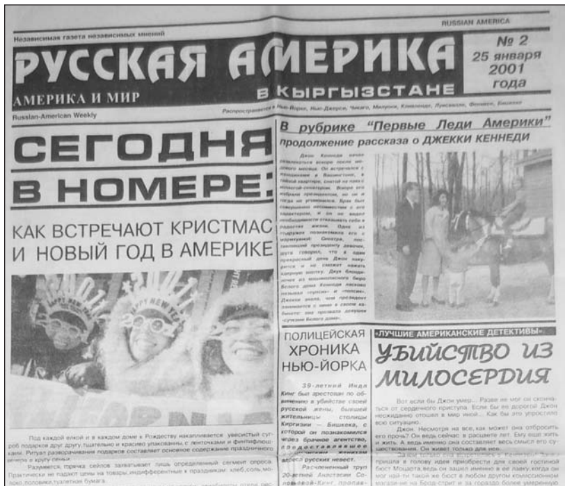
"Русская Америка" - единственная американская русскоязычная газета, которая, под названием "Русская Америка в Кыргызстане", издавалась в другой стране